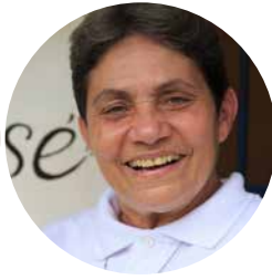
ARJONA RODRÍGUEZ FUNDACIÓN SAN JOSÉ