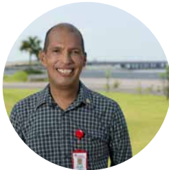
ARIEL MUÑOZ FUNDACIÓN PROBIDSIDA