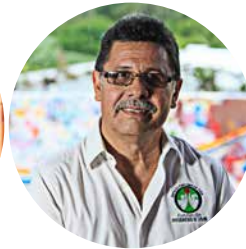
EDUARDO BARSALLO FUNDACIÓN AYUDANDO A VIVIR