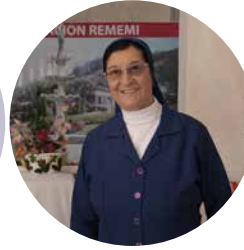
SOR JARA JARA FUNDACIÓN REMEMI