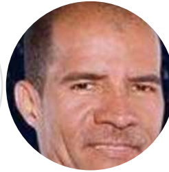
RÓMULO PINEDA FUNDACIÓN SENDERO DE MANGLARES