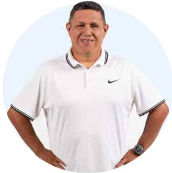
ANTONIN AUZPURÚA ACADEMIA DE FÚTBOL ROMÁN TORRES Panamá