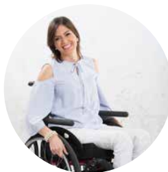
ROSA DOENS SOMOS TODOS