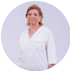
TORIBIA DE ESCUDERO FUNDACIÓN NUTEJE