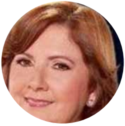
DABAIBA CONTE FUNDACIÓN SOY CAPAZ