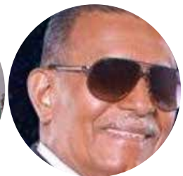
CARLOS CLOP FUNDACIÓN CLUB DE CIEGOS DE COLÓN