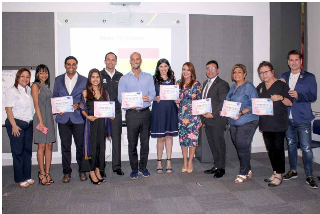
Héroes 2017. Culminación capacitación ONG