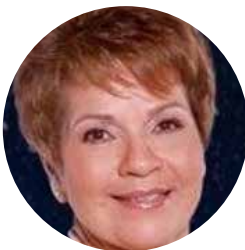
MERCEDES ESPINO FUNDACIÓN CARLOS AROSEMENA ESPINO