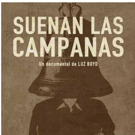
SUENAN LAS CAMPANAS LUZ BOYD