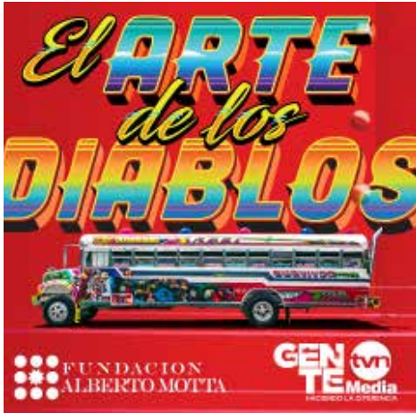
EL ARTE DE LOS DIABLOS BENJAMIN LIAO