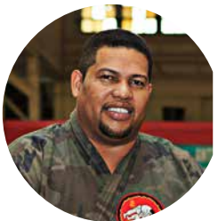
EDELGAR MACRE CLUB SAMURAI