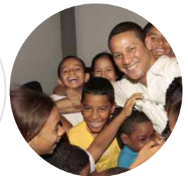
HECTOR BRANDS FUNDACIÓN NUEVA GENERACIÓN