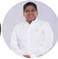
BOLÍVAR CÉSAR FUNDACIÓN CRESCENDO